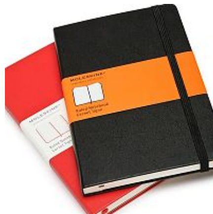
Записные книжки Moleskine