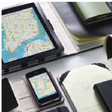
Moleskine для офиса