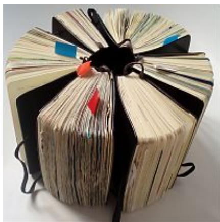
Специальные серии Moleskine