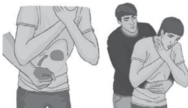
Рисунок 2. Как выполнять прием Геймлиха

После каждого удара проверяйте, не выпал ли инородный предмет. Дозируйте силу ударов, если пострадавший — ребенок