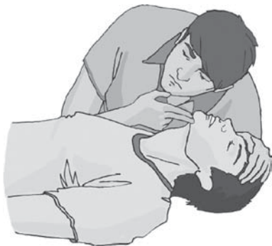
Рисунок 4. Как восстановить проходимость дыхательных путей и определить наличие признаков жизни