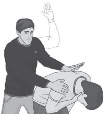
Рисунок 1. Как извлечь инородный предмет с помощью ударов между лопаток