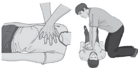
Рисунок 3. Как выполнять давление руками на грудину при сердечно-легочной реанимации

Дозируйте силу ударов, если пострадавший — ребенок