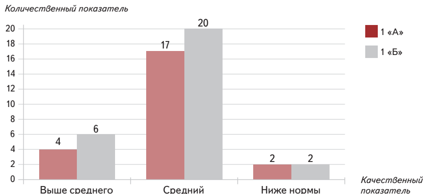
Диаграмма 4. Уровень готовности психологических и психофизиологических функций, которые обеспечивают чтение